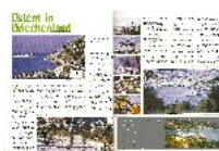
„Zeitensprünge. Ostern in Griechenland“ – Yacht Info 01/2002 (der 1. Artikel)

Seit dem Jahre 2002 schreibe ich ‚so nebenbei‘ Artikel, v.a. für Yachtmagazine. Durch das sehr gute Feedback auf meine Artikelserie im neuen Magazin ‚OCEAN 7‘ bestärkt, möchte ich diese Aktivität in Zukunft stärken.“