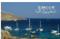
„Strumfahrt in die Kykladen“ – Ocean7 2/09 (der aktuellste Artikel; erscheint im März)